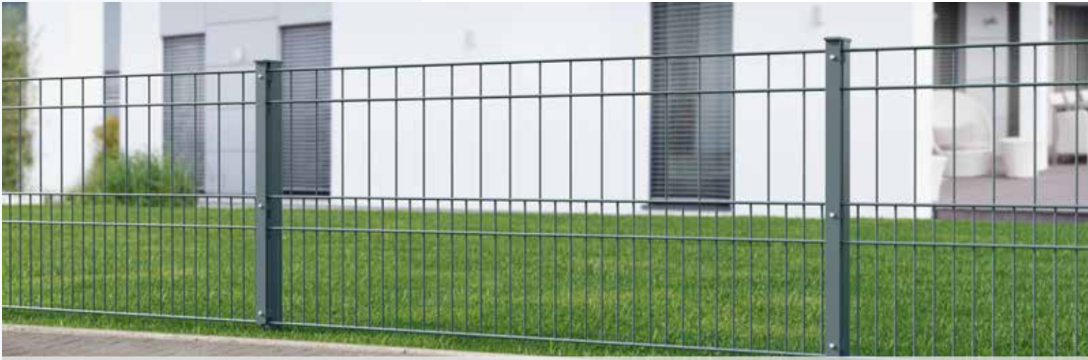
Das Modell MILO fällt durch die verschiedenen Maschenweiten optisch besonders auf